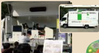
協力:四谷警察署 他