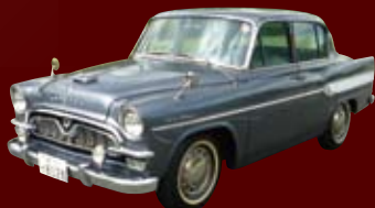
トヨタ博物館所蔵の トヨペットクラウンRS21型もパレードに参加!