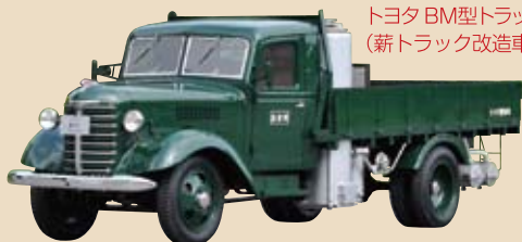
1950 日本 トヨタ BM型トラック (薪トラック改造車)

戦後のガソリン不足に対応して誕生したボンネット型トラック展示。薪ガス発生装置搭載。