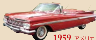
1959 アメリカ シボレー インバラ