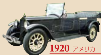
1920 アメリカ パッカード ツインシックス

希少価値の高いトヨタ博物館所蔵車に座れるチャンス!シボレーやパッカードに乗って記念撮影ができます。