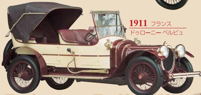
1911 フランス ドゥローニー ベルビュ