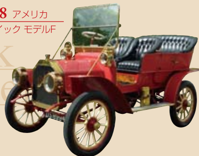
1908 アメリカ ビュック モデルF