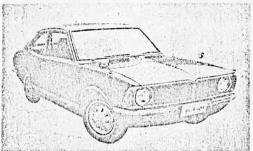
トヨタ スプリンター ラックス (KE25-BD)