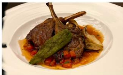
メイン：子羊肉のポワレ (魚料理もご用意しております)