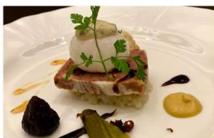
前菜：パテ・ド・カンパーニュ