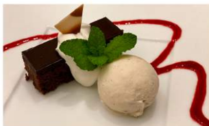
デザート：チョコレート ケーキ。 そばの実のアイスクリーム 風味豊か!