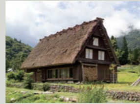
合掌造り家屋(旧下山家)