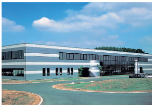
トヨタモーターヨーロッパ R&D/ マニュファクチャリング (ベルギー ブラッセル)