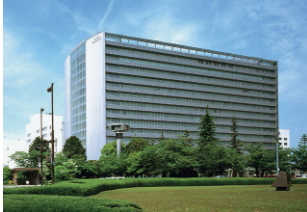
トヨタテクニカルセンター (愛知県豊田市)