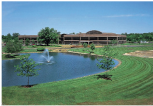
トヨタモーターエンジニアリング & マニュファクチャリングノースアメ リカ(株) (米国ミシガン州)