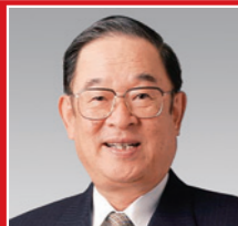
取締役会長 Chairman 張 富士夫 Fujio Cho