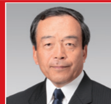
取締役副会長 Vice Chairman 内山田 竹志 Takeshi Uchiyamada