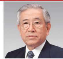
名誉会長 Honorary Chairman 豊田 章一郎 Shoichiro Toyoda