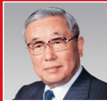
最高顧問 Honorary Advisor 豊田 英二 Eiji Toyoda