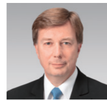
専務役員 Senior Managing Officer Didier Leroy