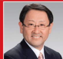
取締役社長 President 豊田 章男 Akio Toyoda