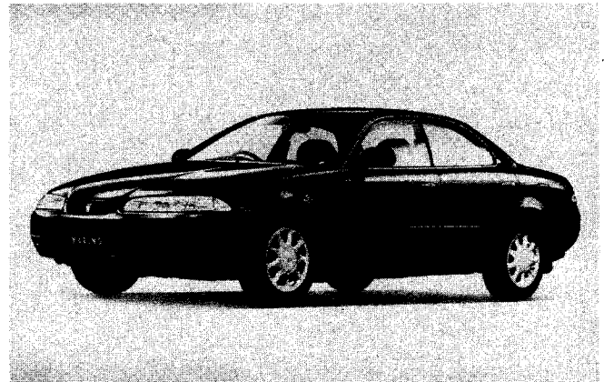
スプリンターマリノ 1600X (E-AE101-BTMEK) 〔オプション装着車〕