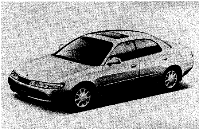
カローラセレス 1600X (E-AE101-ATMEK) 〔オプション装着車〕

(*2) マリノ (MARINO) : イタリア語のMARINO (「海の」)より命名