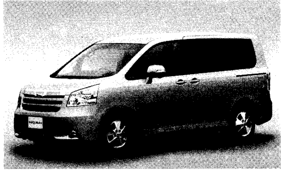
ノア G (2WD) ＜オプション装着車＞