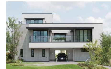
次世代住宅研究施設「賢美健寿 Lab」

寿 いきいきとした 人生を 健康寿命をより長く維持し、 人生を謳歌できる 安全・安心な暮らしを提供します。